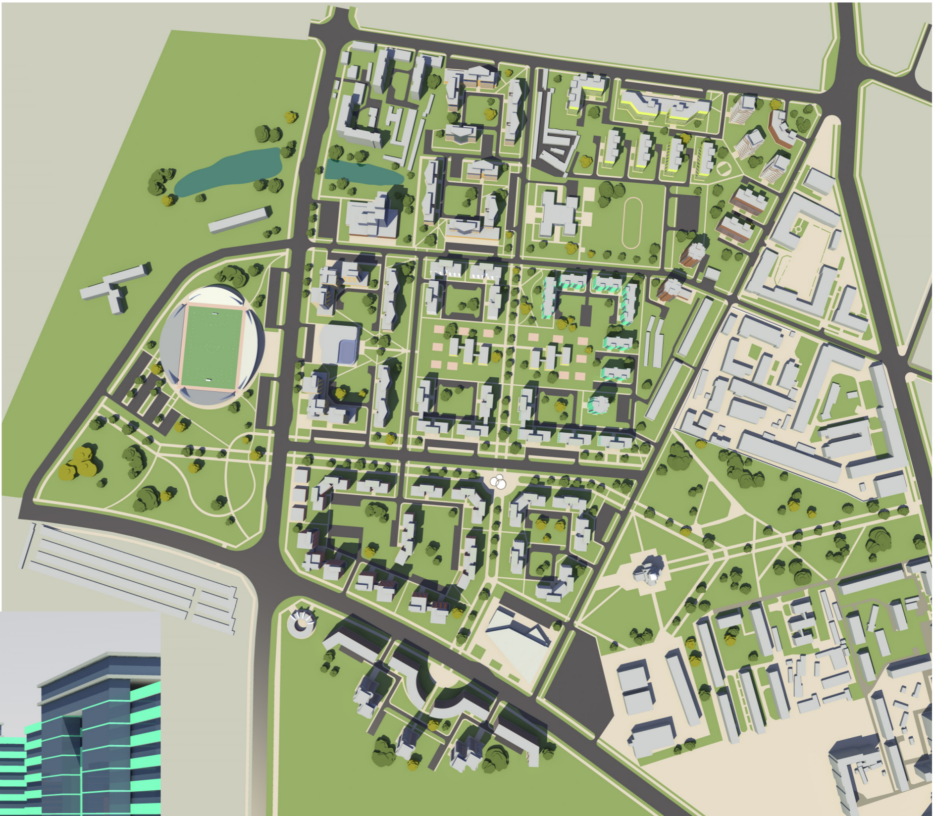
Вид з боку вул. Артема в бік пішохідного бульвару