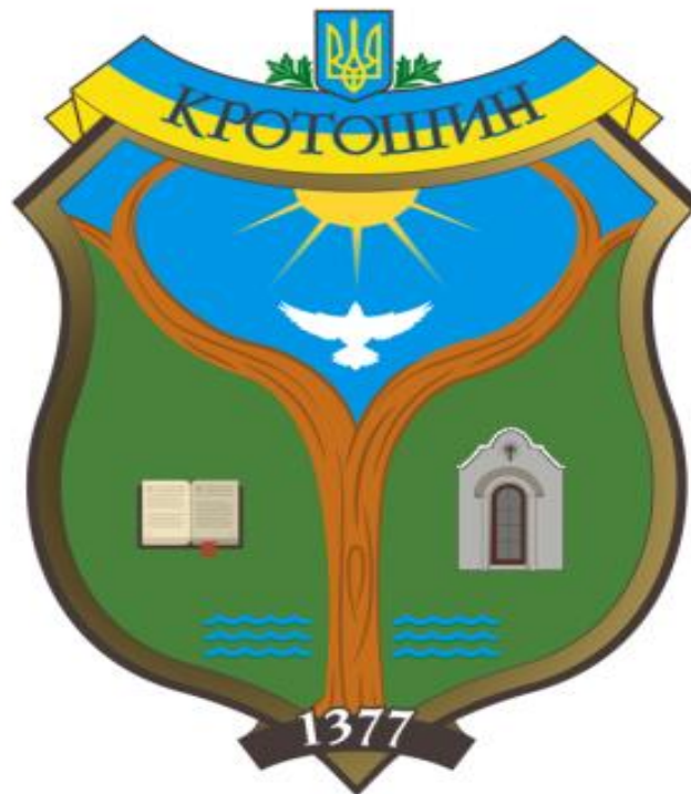
Герб села Кротошин

Додаток №2 до рішення Давидівської сільської ради об'єднаної територіальної громади